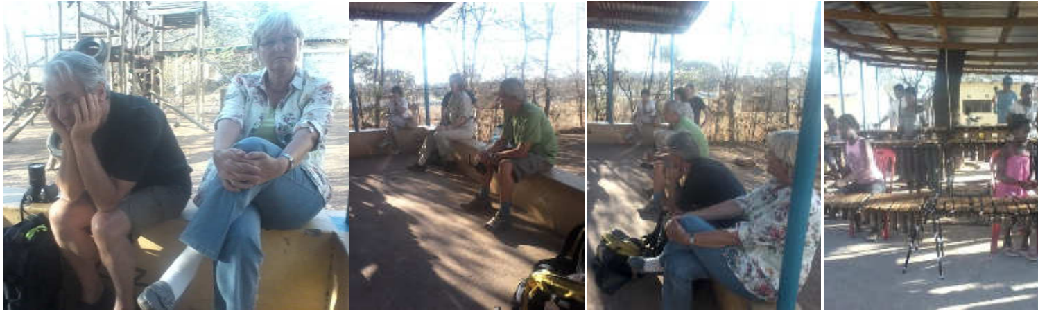
Eine weitere Taruk Gruppe hat unsere Kinder besucht und war begeistert von der Marimba Band